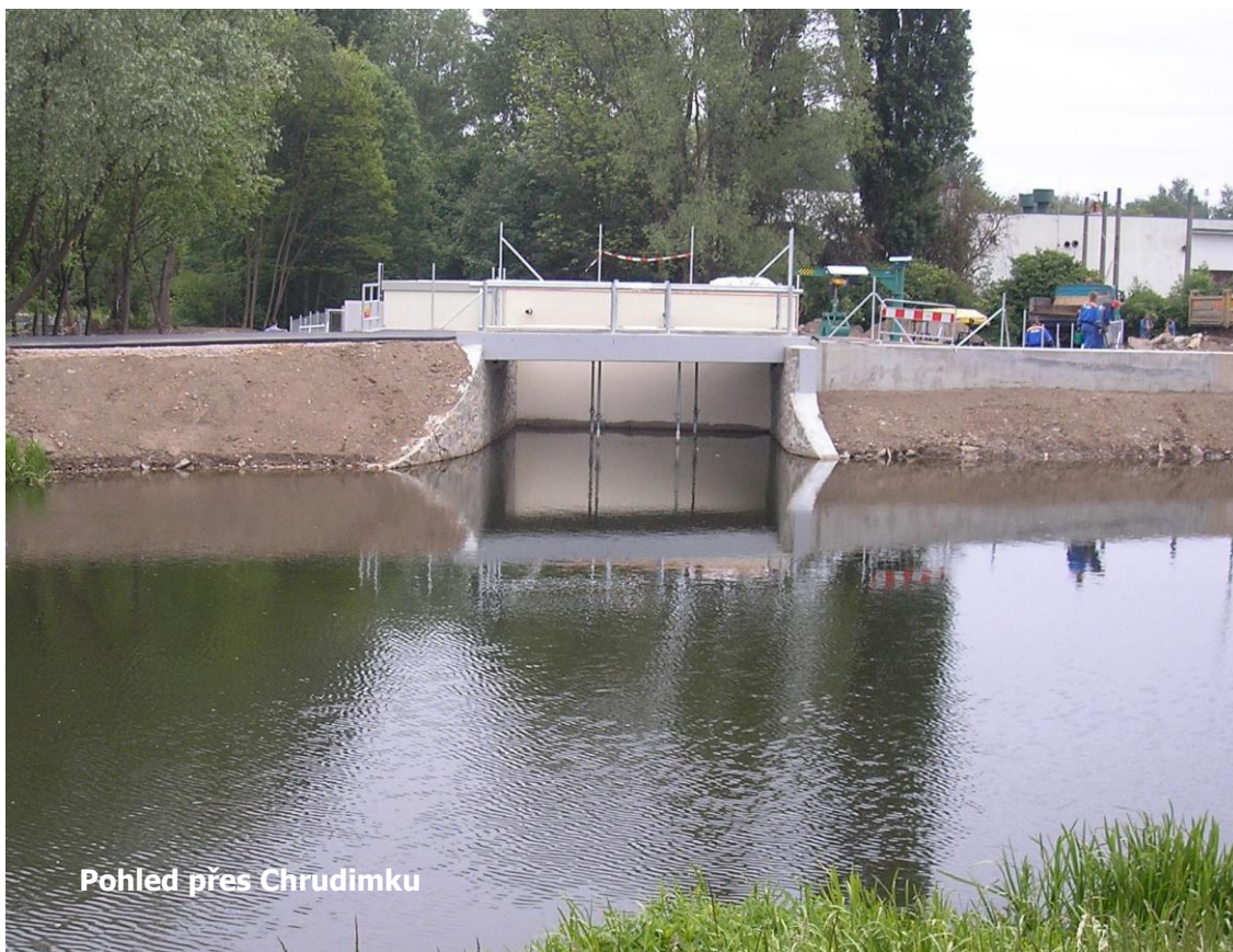
Pohled přes Chrudimku