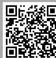
vzor QR kódu

Po příchodu k e-pokladně poklepejte na displej obrazovky, aby se obrazovka rozsvítila a poté naskenujte QR kód uvedený na dokladu, který chcete uhradit. Dále postupujte dle pokynů na obrazovce e-pokladny.